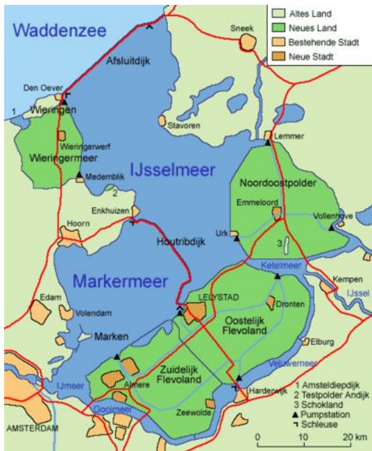
Das holländische IJsselmeer und die Waddenzee